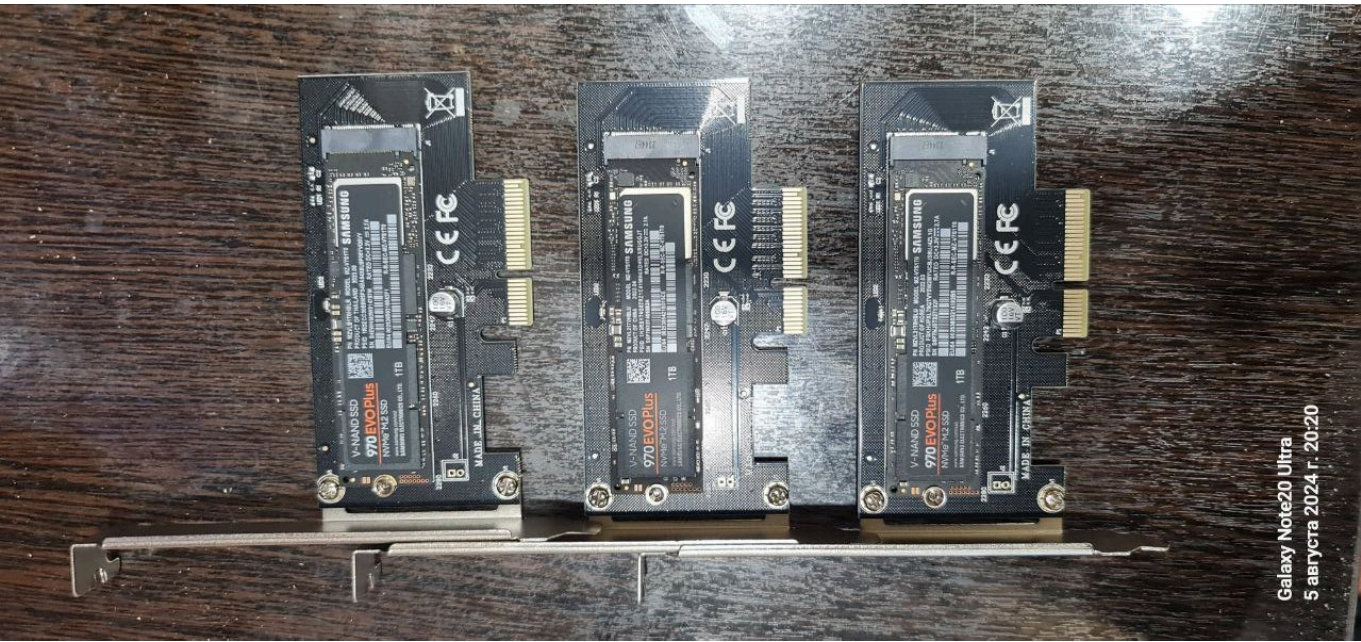
Galaxy Note20 Ultra 5 августа 2024 г. 20:20